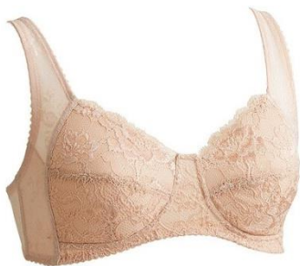
フルカップブラジャー