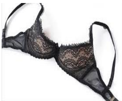
1/4カップ (通称：シェルフカップ)