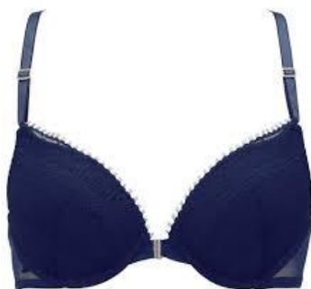
フロントホック ブラジャー