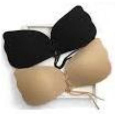
シリコンカップブラジャー