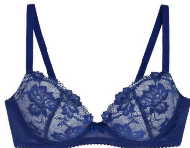
3/4カップブラジャー