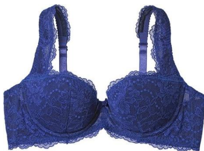
1/2カップブラジャー